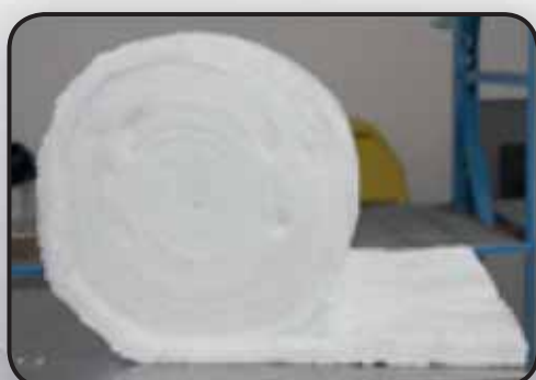
FIBRA CERAMICA ECOLOGICA