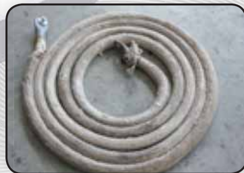
4500MMLUNGHEZZA 2500MMLUNGHEZZA 300X400MM RESISTENZA TIPO SNAKE RESISTENZA TIPO SNAKE RESISTENZA A PANNELLO