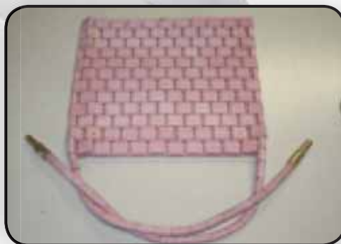
RESISTENZA A PANNELLO RESISTENZA A PANNELLO RESISTENZA TIPO SNAKE