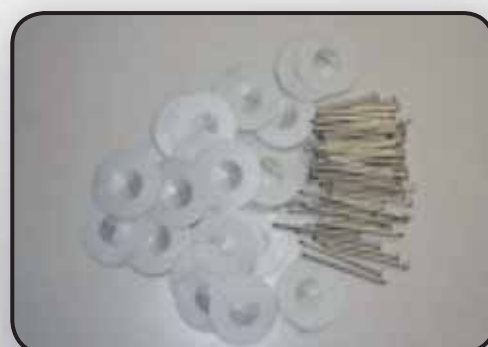
CHIODI E RONDELLE PER FISSAGGIO RESISTENZE E COIBENTE