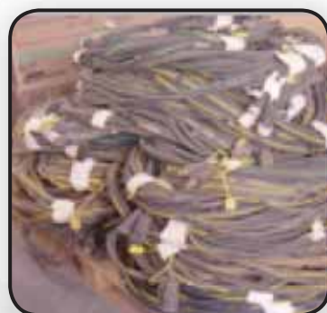
CAVI DI CONNESSIONE