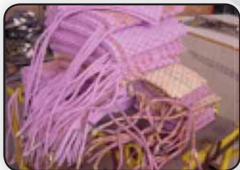
400X850MM 200X1000MM 1700MMLUNGHEZZA